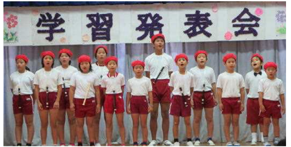
心を込めた「ハッピーメロディ」の合唱

児童のこれまでの学習の成果を保護者や地域の方々に披露しました。学習発表会は、展示の部と舞台発表の部に分けて開催しました。会場へは多くの方々が子ども達のためにご来場いただきました。終了時には、「子ども達の頑張りはとてもすばらしかったです」、「とても感動しました」、「おもわず涙を流しました」等の感想をいただきました。その言葉一つ一つが子ども達の励みにもなり、次の学習への意欲にも繋がったと思います。保護者や地域の皆様大変ありがとうございました。