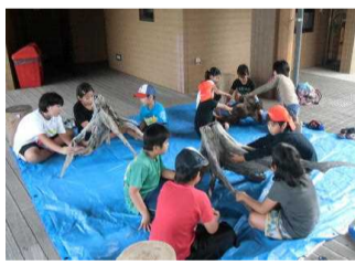
大きな切り株にペイント