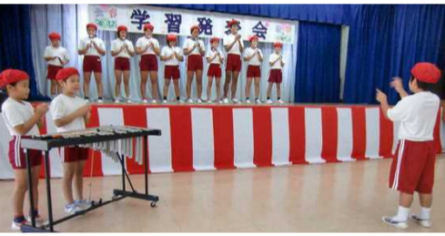
祥太君の指揮のもと心を一つに合奏