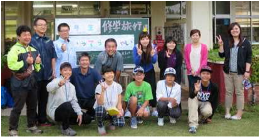
児童・引率合わせ全員で14名の参加でした

西3校（奥小、北国小、佐手小）合同で修学旅行を実施しました。平和祈念公園や対馬丸記念館での平和学習、首里城や沖縄ワールドでの琉球歴史の学習や漆喰シーサー色づけ体験、モノレール乗車体験や国際通り散策、さらには青年会館で寝食を共にしながらの語り合い等を通し、同じ6年生で会話もはずみ、さらに仲良くなりました。平成28年度には国頭中学校に入学するいい仲間です。