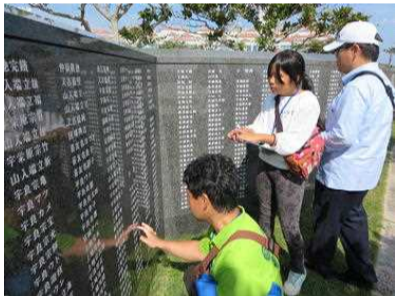
「平和の礎」で奥の方々をみつけました