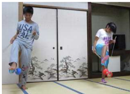
レク大会の様子（中国コマ）の披露