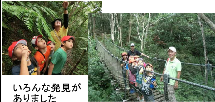
いろいろな発見がありました