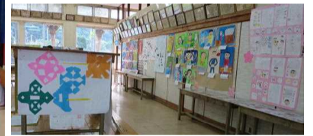
学習の成果の分かる展示